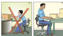
Figure 105. Illustration of a worker using a roller wheel.

Roller wheels handling from handling or moving when handling a heavy load can cause you to get stuck on the roller. Use a protective roller wheel for quite a long period.